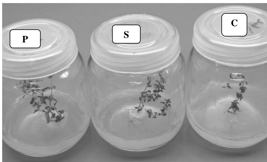
شکل شماره ۲- تأثیر قارچ‌های P. indica و S. vermifera روی رشد گیاه آویشن ( T. vulgaris ) در شرایط درون شیشه‌ای. (P = Piriformospora indica , S = Sebacina vermifera and C = control)