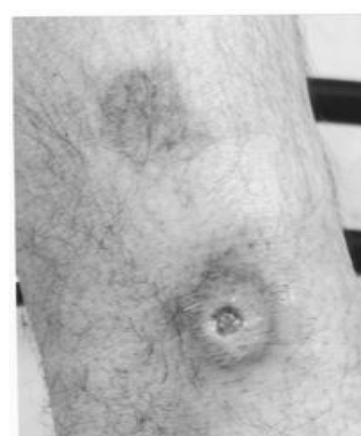
شکل شماره ۱- زخم در هنگام مراجعه