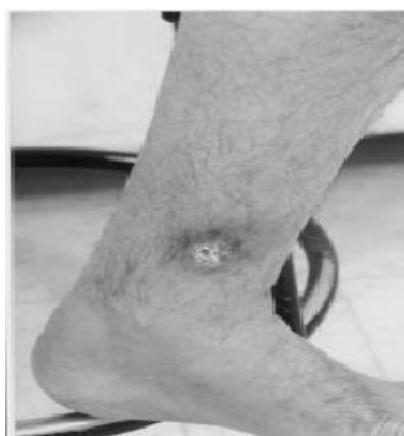
شکل شماره ۲- زخم بعد از یک هفته