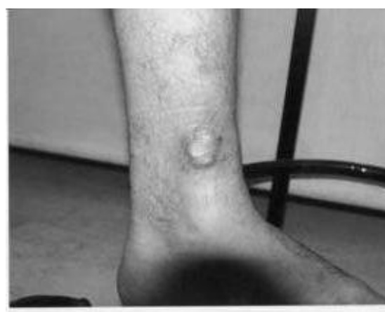
شکل شماره ۴- زخم بعد سه هفته