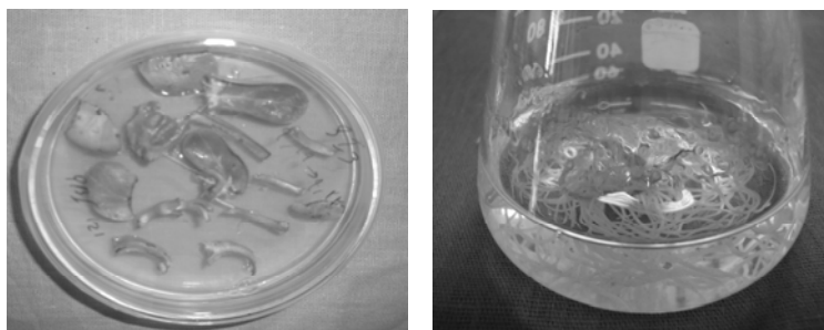
شکل شماره ۳- القا و کشت ریشه‌های موین گیاه خارمریم Silybum marianum