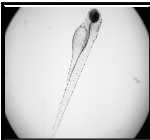
شکل شماره ۳- لارو ماهی زبرا پرورش یافته در مرکز تحقیقات زیست فناوری دانشگاه علوم پزشکی تهران

خارج از رحم صورت می‌گیرد) و به این ترتیب امکان ردگیری اثرات مختلف ترکیبات مورد آزمایش امکان‌پذیر خواهد شد. نکته کلیدی دیگر در بررسی مولکول‌های فعال با استفاده از لارو و جنین این ماهی، امکان افزودن ترکیبات به صورت غیراستریل به محیط رشد آن‌ها است که سرعت انجام روندهای غربالگری را افزایش می‌دهد [۴].