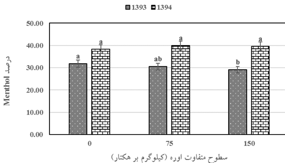
نمودار شماره ۳- مقایسه میانگین سطوح متفاوت اوره بر میزان Menthol در سال‌های ۱۳۹۳ و ۱۳۹۴