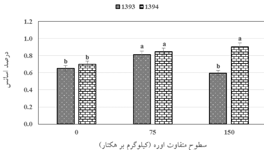
نمودار شماره ۱- مقایسه میانگین سطوح متفاوت اوره (کیلوگرم بر هکتار) بر میزان اسانس در سال‌های ۱۳۹۳ و ۱۳۹۴

مصرف کود اوره در سال‌های متفاوت نیز تأثیر معنی‌داری بر اغلب اجزای اسانس به جزء \beta -Pinene، Myrcene، \alpha -Terpineol و Z- \beta -Ocimene، 1,8-Cineole، Limonene داشت (جدول شماره ۴). میزان Menthone در سال ۱۳۹۳ (۲۸/۸ درصد) بیشتر از سال ۱۳۹۴ (۱۱/۲ درصد) بود و برعکس میزان Menthol در سال ۱۳۹۴ (۳۹/۳ درصد) ۸/۸ واحد بیشتر از سال ۱۳۹۳ (۳۰/۵ درصد) بود. میزان Menthone در تیمار ۷۵ کیلوگرم اوره در هکتار در هر دو سال آزمایش تفاوت معنی‌داری با تیمار شاهد نداشت و مصرف اوره ۱۵۰ کیلوگرم در هکتار در سال ۱۳۹۳ موجب افزایش میزان Menthone و در سال ۱۳۹۴ موجب کاهش میزان Menthone نسبت به تیمار شاهد شد (نمودار شماره ۲). استفاده از کود نیتروژن در سال ۱۳۹۴ تأثیر معنی‌داری بر میزان Menthol نداشت اما در سال ۱۳۹۳ مصرف ۱۵۰ کیلوگرم در هکتار اوره (۲۹/۱ درصد) موجب کاهش معنی‌دار میزان Menthol در مقایسه با تیمار شاهد (۳۱/۹ درصد) شد (نمودار شماره ۳).