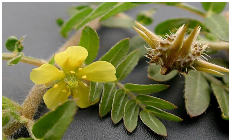
تصویر شماره ۲- تصویر گیاه خارخاسک و بخش‌های مختلف آن