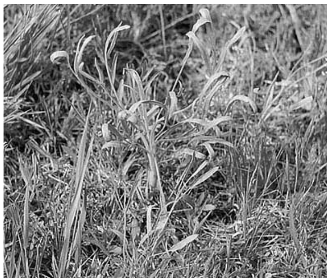
شکل شماره ۱- گیاه Falcaria vulgaris

میزان ۲/۱۵ درصد وزنی / حجمی بوده و در آن ترکیبات اصلی زیر شناسائی شدند (جدول شماره ۱). پس از بررسی گیاه Falcaria vulgaris ، ۶۴ ماده از ترکیبات موجود در اسانس آن شامل ۸۳/۸ درصد از کل مقدار اسانس آن شناسایی شدند. بیشترین مقدار اجزای آنرا ترکیباتی نظیر اسپاتونول (۲۷/۰۸ درصد) و کارواکرول (۲۰/۹۳ درصد) تشکیل داده‌اند (شکل شماره ۲). گونه دیگری از این گیاه که در ایران رویش دارد، Falcaria falcaroides است. نتایج تحقیقی که توسط دکتر روستاییان و همکاران بر روی این گیاه انجام گرفت ۲۴ ترکیب را که در مجموع ۹۷/۶ درصد از کل روغن فرار گیاه را تشکیل می‌دهند، مشخص کرد [۷]. در میان این ترکیبات ژرماکرن B (۶۷/۹ درصد) اصلی‌ترین ترکیب این گیاه است.