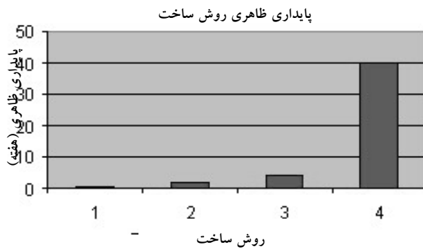
شکل شماره ۳- نمودار پایداری ظاهری بر حسب روش ساخت

در شکل شماره ۳ تاثیر روش ساخت بر پایداری ظاهری نمونه‌ها بر اساس جدول فوق مشاهده می‌شود: