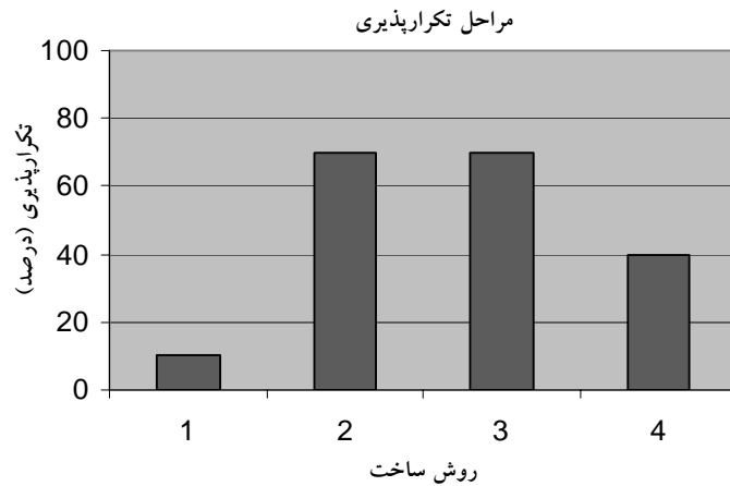
شکل شماره ۲- نمودار تکرارپذیری بر حسب روش ساخت