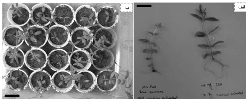
شکل شماره ۲- ریشه‌زایی و سازگاری گیاه به لیمو. ۲- الف- مقایسه ریشه‌زایی در تیمار هورمونی حاوی ۰/۵ میلی‌گرم در لیتر IBA و ۲ میلی‌گرم در لیتر ذغال فعال با تیمار محیط کشت پایه MS بدون ذغال فعال، چهار هفته پس از کشت. ۲- ب- گیاهچه‌های سازگار شده به لیمو در شرایط برون شیشه‌ای (مقیاس = ۲ سانتی‌متر).

جدول شماره ۲- اثرات غلظت‌های مختلف IBA و NAA به تنهایی و یا در ترکیب با ذغال فعال بر درصد ریشه‌زایی و طول ریشه‌ها چهار هفته بعد از کشت.