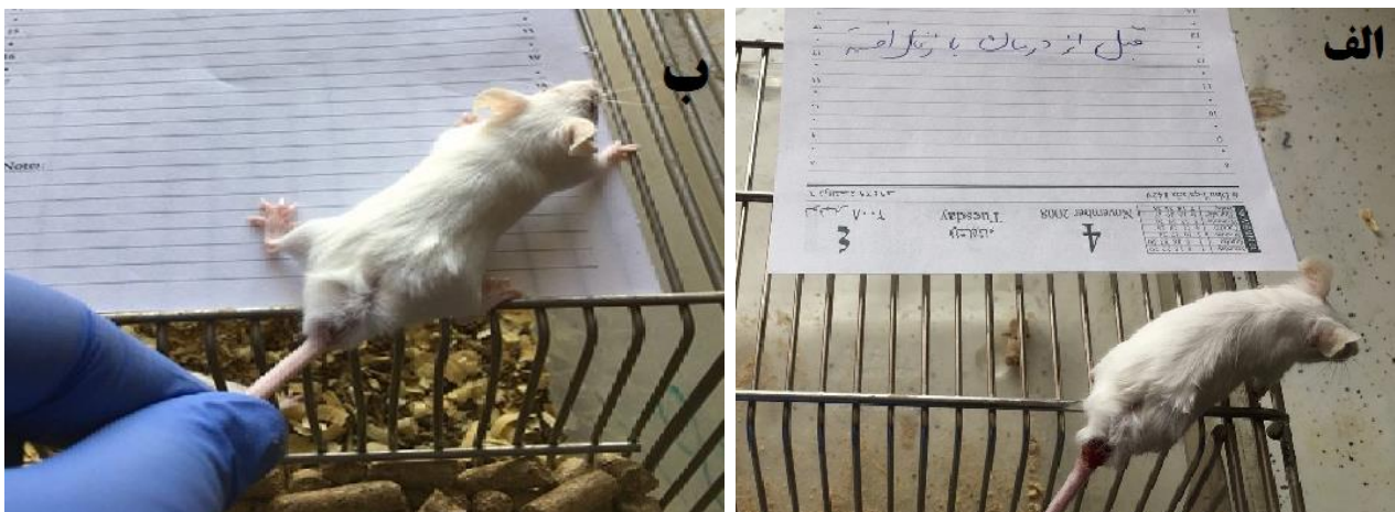
شکل ۲. موش آلوده شده با لیشمانیا ماژور، گروه تیمار شده با عصاره زغال اخته با غلظت ۴۰۰ میلی‌گرم بر کیلوگرم الف) قبل از درمان ب) پس از درمان