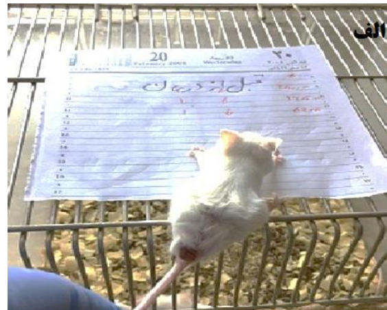
شکل ۳. موش آلوده شده با لیشرمانیا ماژور، گروه تیمار شده با داروی گلوکانتیم (الف) قبل از درمان (ب) پس از درمان