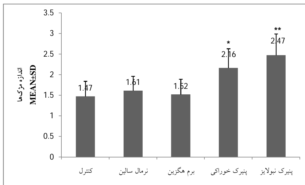
باردیاگرام شماره 3- مقایسه اندازه مژک‌های اپی تلیال نای در گروه‌های مختلف (N=6, p**<0/05)