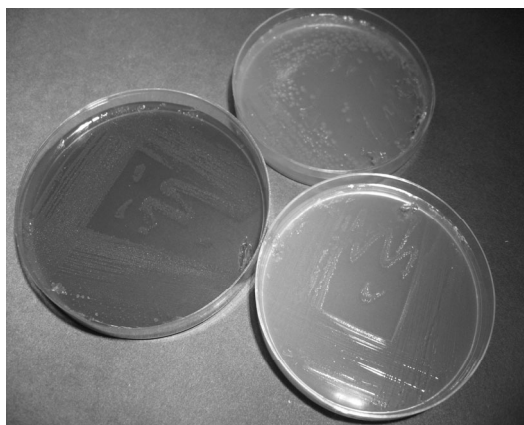
شکل شماره ۳- کاهش پیگمان‌زایی سودوموناس آئروجینوزا تحت تاثیر غلظت‌های کمتر از بازدارنده عصاره سیر و هل

هم‌چنین در مانیتول سالت آگار ۱ تغییری به وجود نیامد. هم‌چنین باکتری در حضور عصاره سیر و هل مانند شاهد (فاقد