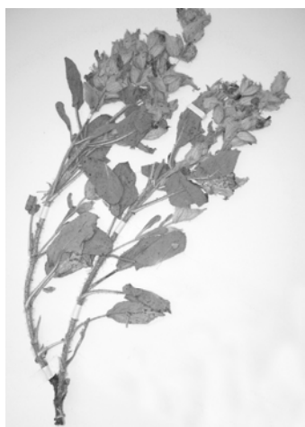
شکل شماره ۱- گونه Salvia macrochlamys Boiss & Kotschy

در مطالعه دیگری که روی اسانس دو گونه S. aethiopsis و S. hypoleuca توسط روستایان و همکاران صورت گرفت، \beta -Caryophyllene به ترتیب (۲۴/۶ و ۲۲/۰