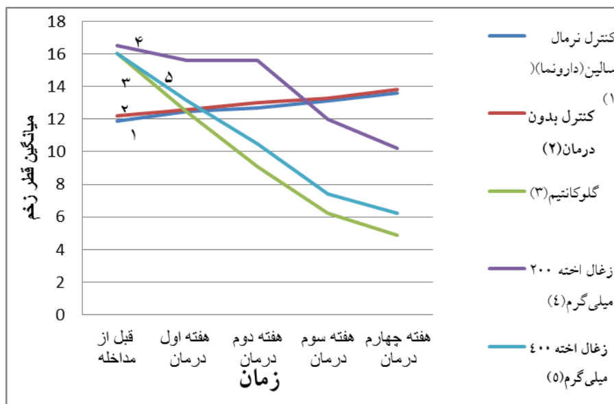
نمودار ۱. نتایج قطر زخم در گروه‌های مورد مطالعه در زمان‌های مورد بررسی

قبل و پس از تیمار در گروه‌های دریافت‌کننده گلوکانتیم، زغال اخته ۲۰۰ و ۴۰۰ میلی گرم برکیلوگرم به طور معنی‌داری از گروه‌های کنترل نرمال سالیین و کنترل بدون درمان بیشتر است ( P < 0.001 ). همچنین در مقایسه بار انگلی قبل و پس از درمان در تمامی گروه‌های مورد مطالعه به جز گروه کنترل بدون درمان تفاوت معنی‌داری مشاهده شد ( P < 0.05 ) به