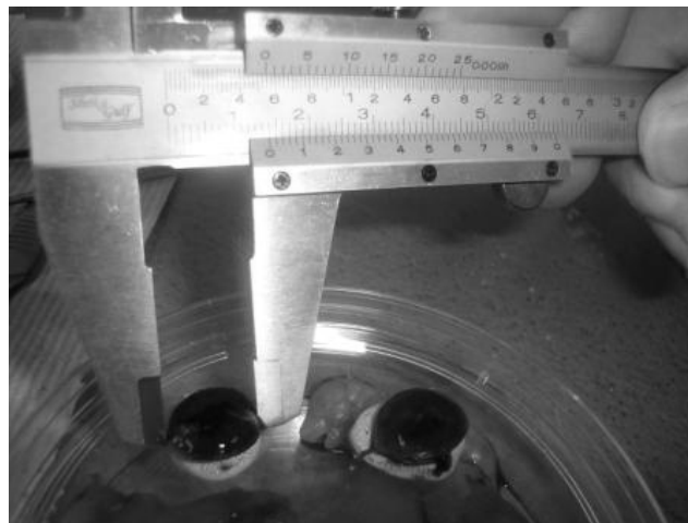
شکل شماره ۲- روند اندازه‌گیری قطرهای کوچک و جفت

قابل ملاحظه‌ای بلندتر از گروه شاهد بود. این موضوع بیانگر این است که مصرف آویشن اگر چه ممکن است تاثیری بر لانه‌گزینی و سقط جنین‌ها نداشته باشد ولی می‌تواند منجر به بروز ناهنجاری‌های فرعی و تغییر در رشد اندام‌های انتهایی شود. جزء اصلی عصاره گیاه آویشن تیمول و کارواکول است که هر دو خاصیت آنتی‌اکسیدانی دارند [۴] و گزارش‌های ضد و نقیضی درخصوص اثرات سیتوتوکسیک و موتاژنیک ترکیبات مختلف آویشن وجود دارد. سام‌جیما ۱ و همکاران گزارش کردند که لوتولین موجود در عصاره آویشن اثر آنتی‌موتاژنیک دارد [۲۱]. همچنین آپیک ۲ و همکاران نشان دادند که کارواکول جداشده از آویشن، مبادله کروماتید خواهری را در لوکوسیت‌های انسانی افزایش نمی‌دهد [۲۲]. از طرف دیگر بویوکیلا ۳ و رنسوزوگولار ۴ گزارش کردند که تیمول موجود در آویشن به ویژه در غلظت‌های پایین موجب افزایش مبادله کروماتید خواهری و ناهنجاری‌های کروموزومی در لوکوسیت‌های انسانی می‌شود [۲۳] در حالی که قبلاً در سال ۲۰۰۵ آیدین ۵ و همکاران گزارش کرده بودند که تیمول و گاما-ترینین موجود در آویشن تنها در غلظت‌های بالا منجر به آسیب DNA می‌شود [۲۴] و اخیراً آزیراک ۶ و همکاران نیز گزارش کرده‌اند که تیمول و کارواکول به یک روش وابسته