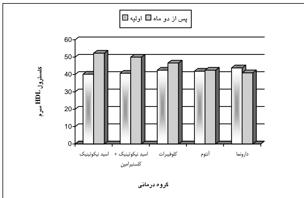
شکل شماره ۳- میزان تغییرات کلسترول HDL سرم پس از دو ماه درمان در پنج گروه درمانی (P=۰/۰۰۱)