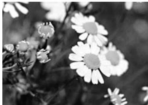
شکل شماره ۱ - گیاه و گل بابونه