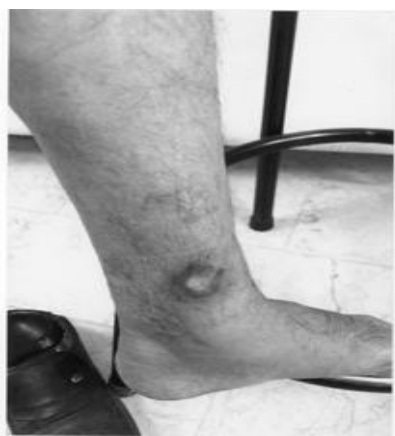
شکل شماره ۳- زخم بعد از دو هفته