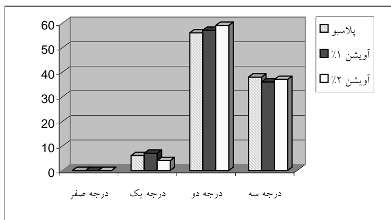
نمودار شماره ۲ - درصد فراوانی درجه شدت دیسمنوره در سه گروه قبل از درمان بر اساس مقیاس نمره‌گذاری چند بعدی p = 0/4 *

**میانگین و انحراف معیار نمرات شدت درد در متن آورده شده است.