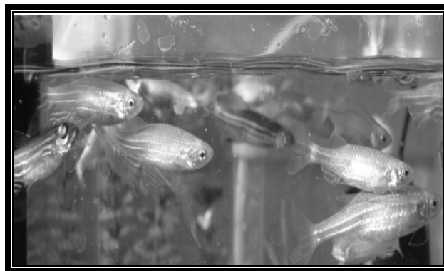
شکل شماره ۱- ماهی زبرا بالغ پرورش یافته در مرکز تحقیقات زیست فنآوری دانشگاه علوم پزشکی تهران

جدول شماره ۱- طبقه‌بندی علمی ماهی Danio rerio (1).