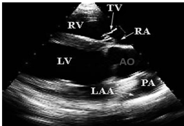
شکل شماره 2- نمای تصویرگیری اکوکاردیوگرام محور طولی سمت راست از پنجره صوتی سمت راست جهت اندازه‌گیری تغییرات اکوکاردیوگرام آئورت. دهلیز راست (RA)، دریچه سه لته (TV)، بطن راست (RV)، آئورت (AO)، سرخرگ ششی (PA)، گوشک چپ (LAA)، بطن چپ (LV).