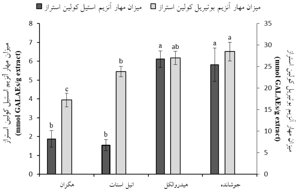
شکل شماره ۳- میزان مهار فعالیت آنزیم‌های استیل و بوتیریل کولین استراز توسط جوشانده و عصاره‌های گیاه آویشن ایرانی (بارها نشان‌دهنده انحراف استاندارد بوده و برای هر صفت ستون‌های دارای حداقل یک حرف مشترک از نظر آماری تفاوت معنی‌داری ندارند).