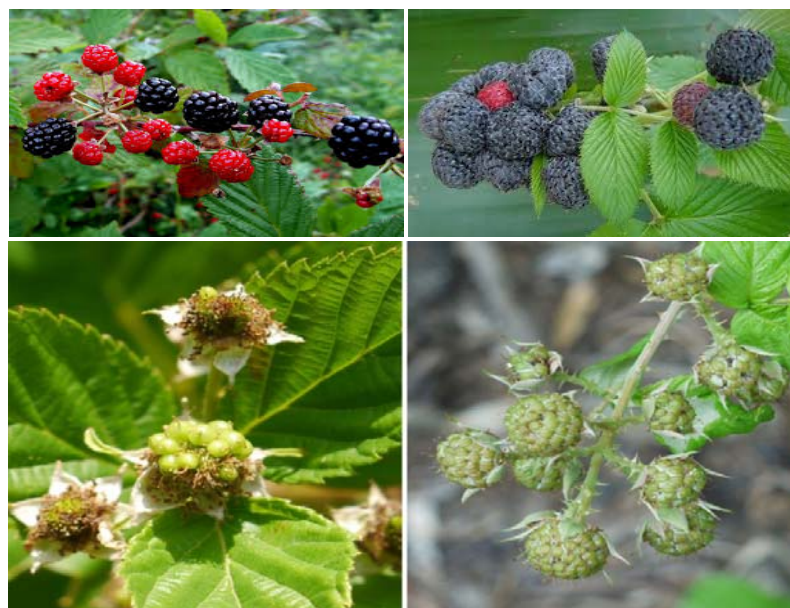
شکل شماره ۱- میوه و گیاه تمشک