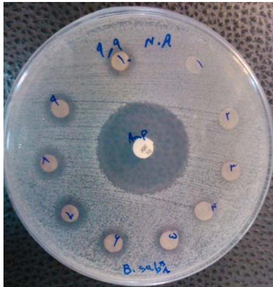
شکل شماره ۱- هالی عدم رشد باکتری باسیلوس سوبتیلیس ( Bacillus subtilis )

۱ mg/ml = ۱ و ۲ mg/ml = ۲ و ۳ mg/ml = ۳ و ۴ mg/ml = ۴ و ۵ mg/ml = ۵ و ۶ mg/ml = ۶ و ۷ mg/ml = ۷ و ۸ mg/ml = ۸ و ۹ mg/ml = ۹ و شاهد = آمپی سیلین ۱۰ µg/disc